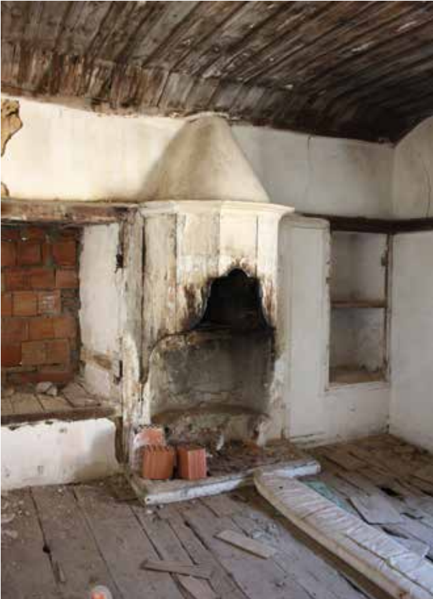
Fig. 5: Üst kat kuzeydoğu oda ocak nişi