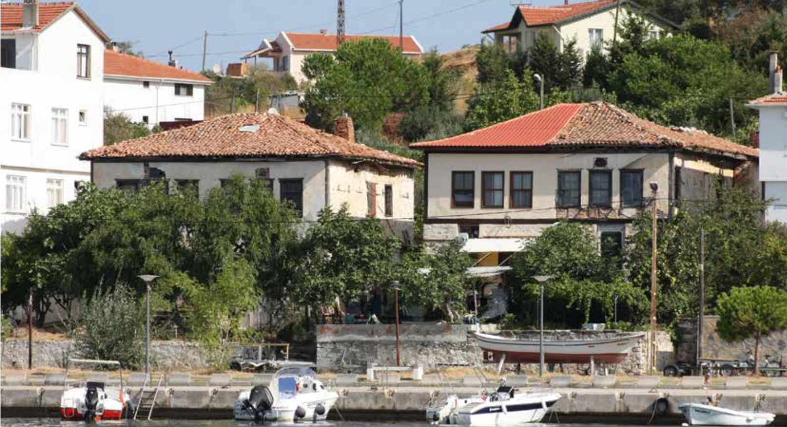
Fig. 1: Tahsin Tutucu Evi ve doğusundaki ikiye bölünmüş evin denizden genel görünümü

giriş kapısı yanında net okunamayan ancak 19. yüzyıla işaret eden, bir diğerinde ise 1827 tarihli kitabesi bulunur ve öyküyle uyumlu tarihe dayanarak bu yapı da 19. yüzyıla atfedilebilir. Ayrıca yapının üst katındaki güneybatı odada yer alan şerit manzara betimleri ve tavan süslemeleri de 19. yüzyıla işaret etmektedir. Eski fotoğraflarda Yedi Kardeşler evlerinin aslında üç katlı olduğu anlaşılmaktadır (Lev. XI-XII no.44). Üçüncü katların ortadan kalkması 1912 Mürefte ve/veya 1935 Marmara depremleriyle ilgili olabilir.