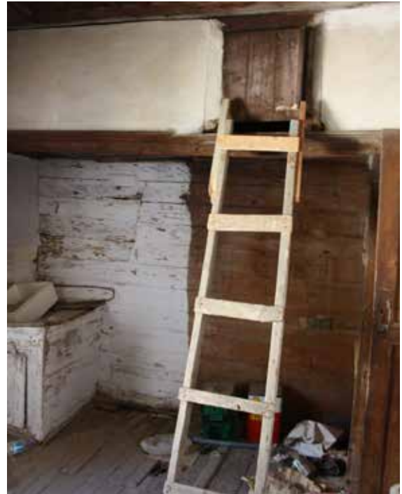
Fig. 6: Üst kat kuzeydoğu oda güney duvar düzenlemesi