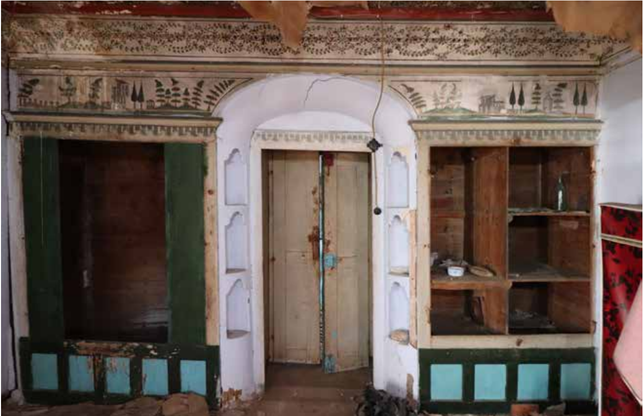
Fig. 8: Üst kat güneybatı oda dolap düzenlemesi ve resimli panolar genel

Güneybatı odayı sofadan ayıran bağdadi duvarın oda tarafı dolap şeklinde düzenlenmiştir ve sofadan erişim bu düzenlemenin ortasına konumlandırılan çift kanatlı kapı ile sağlanır (Fig. 9). Kapı kanatları açıkken gerisinde kalan dolaplar ile oda mekanı arasındaki kısım yuvarlatılarak üçer niş oluşturulmuştur. Batı tarafta yüklük, doğu tarafta ise ikiye bölünerek dolap şeklinde düzenlenmiştir. Her iki tarafın da kapak kanatları eksiktir. Bu oda da güneydoğudaki oda gibi güney yöndeki deniz manzarasına üç adet dikdörtgen pencere ile açılır ve ortadakinin üzerinde yer alan tepe penceresi sonradan iptal edilmiştir. Batı duvarın güney ucunda, dışa doğru daralan bir pencere açıklığı bulunur.