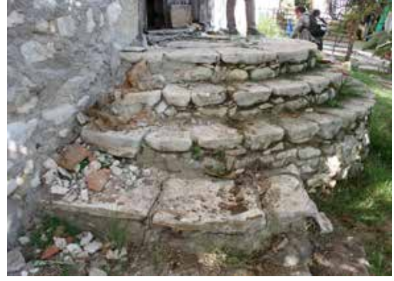
Fig. 3: Merdiven kuruluşu