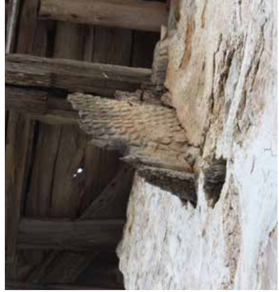
Fig. 4: Batı cephe kuzey uçtaki ahşap kartal figürü kalıntısı