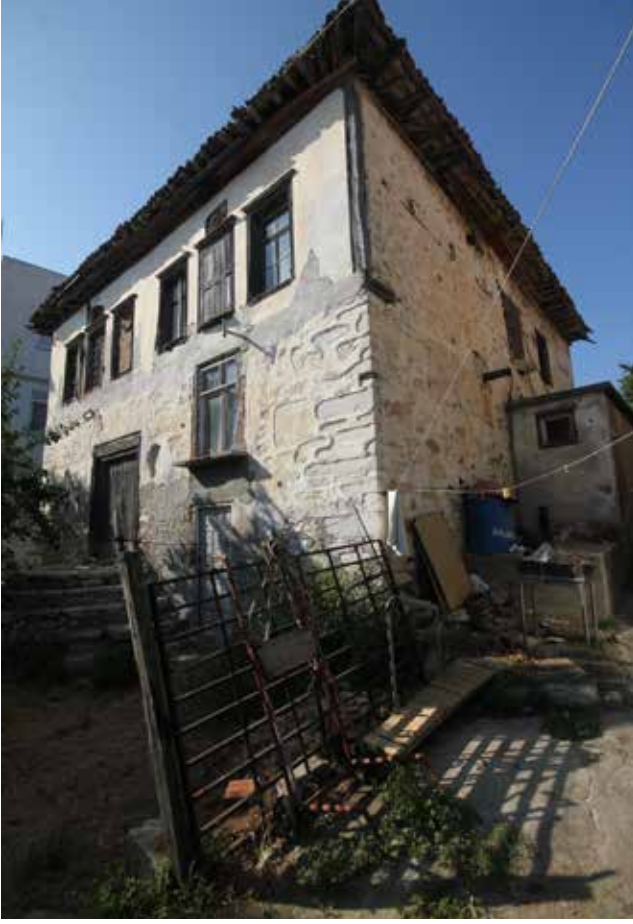
Fig. 2: Güney ve doğu cepheler