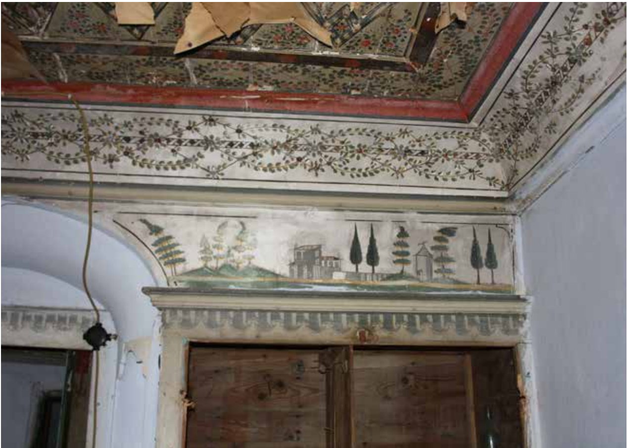
Fig. 11: Sağ pano