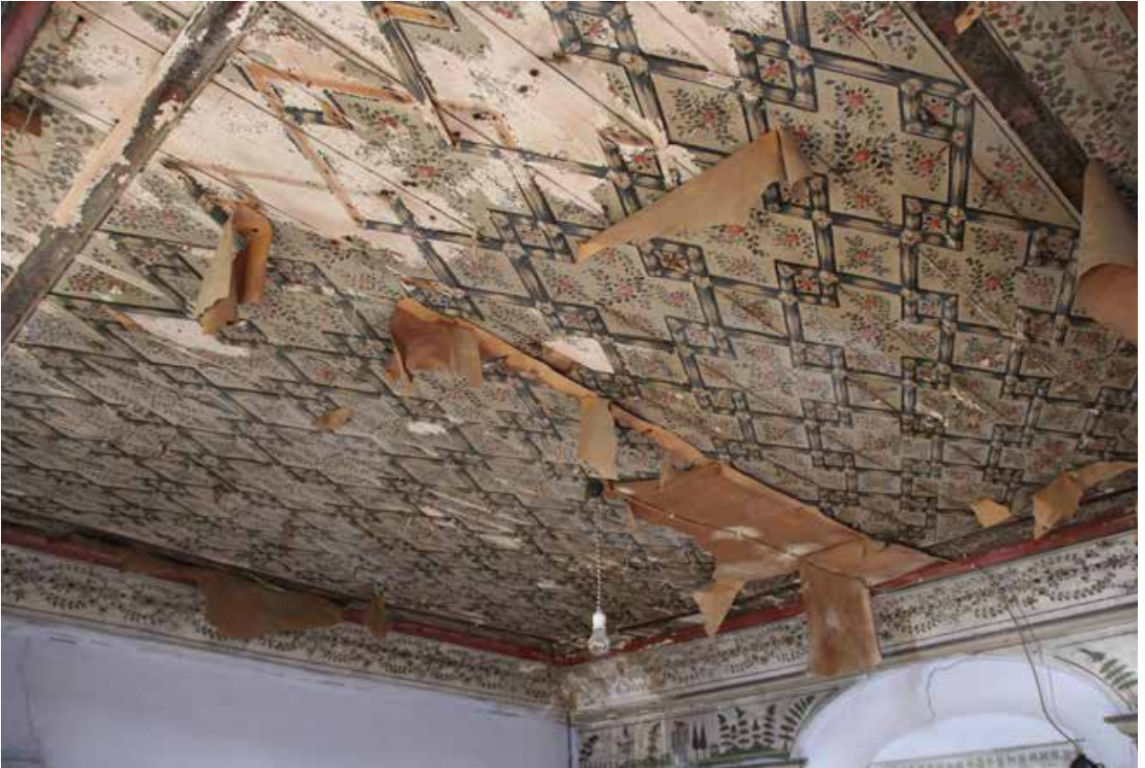
Fig. 13: Çitakâri tavan süslemesi genel

boya tabakalarının ayrışmasına (tozumasına) ve taşıyıcıdan ayrılmasına sebep olacağından bu bozulmaların önüne geçilmediği takdirde boya tabakasındaki kayıp artmakta ve duvar resmi özgün malzeme kaybına uğramaktadır. Kuzey duvardaki resimlerde sıva tabakasının genel itibariyle korunmuş olduğu ancak yer yer ayrılmaların ve kılcal çatlakların bulunduğu tespit edilmiştir (Fig. 16-17). Özellikle kuzey duvarın doğu ve batı duvarları ile kesiştiği noktalarda geniş açıklıklar bulunmaktadır ve bu durumun ana taşıyıcıyı da etkilemiş olabileceği düşünülmektedir (Fig. 16). Bu ayrılmalar ve kılcal çatlaklar, kontrol altına alınmadığı takdirde ilerleyen süreç içerisinde daha ciddi müdahaleleri gerekli kılacaktır. Resim yüzeyinin genelinde siyah bir is tabakası gözlemlenmiştir (Fig. 17). Bunun sebebini nem problemi, su kaynaklarının kontrol altına alınmaması, bakımsızlık, kullanım aşamasında ısınma ihtiyacının soba ile sağlanması, kapı ve pencerelerin korunaksız oluşu olarak çeşitlendirmek mümkündür. Tüm bu sebepler pek çok sorunu beraberinde getirmektedir. Bu sorunlardan bir diğeri ise; resim