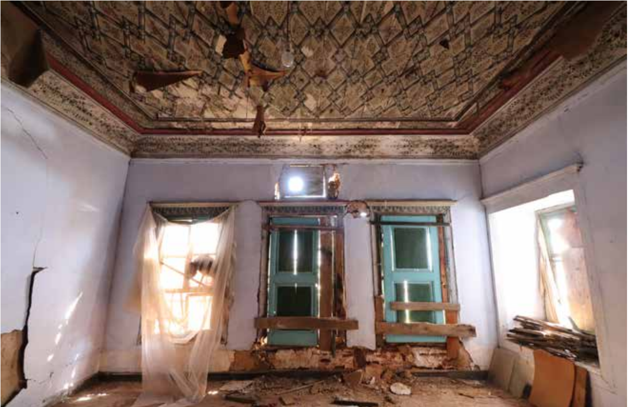
Fig. 9: Güneybatı oda güney duvarı genel görünümü

Bu iki manzara betimli panonun üst hizasında dört duvar boyunca uzanan tavan eteğinde zeytin dalı kompozisyonu uzanır (Fig. 8-11). İki çift zeytin dalı ortada yatay uzanan ve üzeri çapraz kurdele ile sarı bir çubuk etrafında biri eşkenar dörtgen, diğeri yumurta biçiminde kesişerek uzanır. Zeytin dalı kuşağında yeşil, toprak sarısı, gri ve kahverengi görülür. Tavanın yüzeyi ile eteği arasında kırmızı renkli bir şerit yer alır. Düz ahşap tavanın üzeri köşelerinden kesişen eşkenar dörtgenler şeklinde düzenlenen çıtakari ile hareketlendirilmiş ve çıtalar arasında oluşan alanlar şematik bitkisel bezeme ile doldurulmuştur (Fig. 9, 13). Açık gri-yeşil arası bir arka fon üzerinde ortada kırmızı-pembe bir çiçekten gelişen yeşil yapraklı kompozisyonlar yinelenmiştir. Çıtaların üzeri kesişim noktalarında ve köşelerde