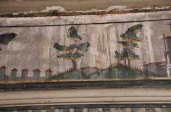
Fig. 14: Kuzey duvardaki su sızıntıları