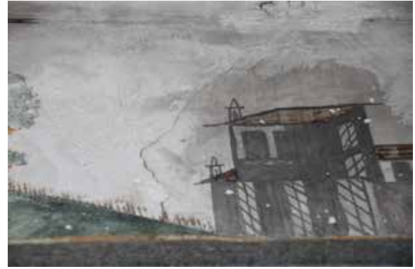
Fig. 17: Niteliksiz boya, çatlaklar ve is tabakası

yüzeyinin bazı bölümlerinde gözlemlenen kılcal çatlaklardır. Yapının uzun süre uygun olmayan ısı ve nem koşullarına maruz kalması sebebiyle boya katmanlarında yapısal çatlaklar gözlemlenmiştir (Fig. 10, 17).