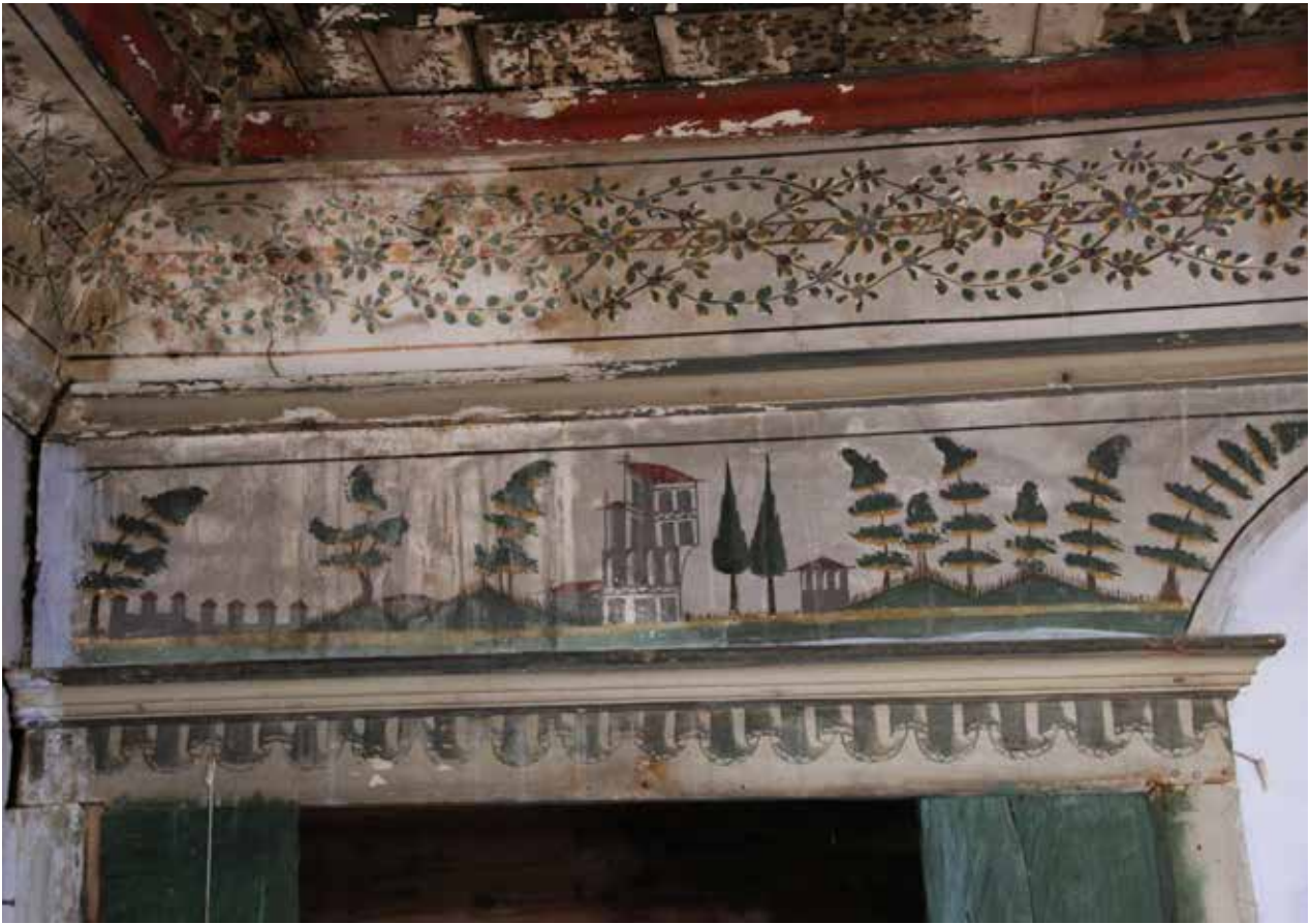
Fig. 10: Sol pano