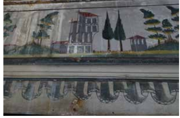
Fig. 15: Kuzey duvardaki su sızıntıları ve dolaptaki barok süsleme detayları