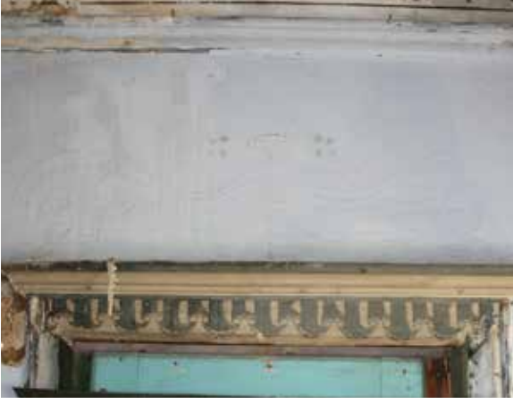
Fig. 12: Güney duvar batı pencere üzerindeki badanalanmış duvar resmi izleri

kontrolü sağlanamaması sebebiyle çeşitli problemlere sebebiyet verdiği gözlemlenmiştir. Kireç bağlayıcılı sıvalarda çözünmüş karbondioksit içeren su, kalsiyum karbonat ile reaksiyona girerek bozulmaya neden olmaktadır. Bu sebeple duvarlar ve ortamdaki nem değişkenlikleri, su sızıntıları, yükselen nem ve yoğunlaşma tüm yapı malzemelerinde olduğu gibi boya tabakalarında da çeşitli bozulmalara yol açmaktadır (Fig. 14-15). Sürekli tekrarlanan ıslanma-kuruma döngüsü,