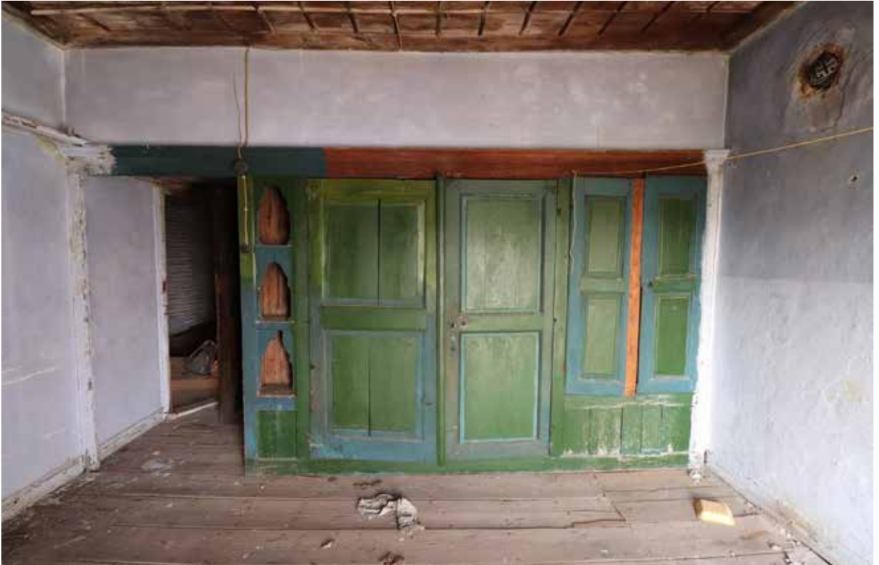
Fig. 7: Üst kat güneydoğu oda dolap düzenlemesi

Üst kata erişim kuzey bahçeye açılan kapının yakınında, güney yönde yükselen on basamaklı ahşap merdiven ile sağlanır. Merdiven düzenlemesi üst katta L-biçimli kapalı bir iç sofanın iç köşesine erişir. L-biçimli sofanın doğu yanında sonradan mutfak olarak tadil edilmiş bir mekan yer alır; güneydoğu köşesinden erişilen güneydoğu odası, güneyinden erişilen güneybatı odası ve iç köşeden erişilen kuzeybatı odası ile çevrilidir. Sofa batıda bir pencere ile dışa açılır. Bu pencere içine oturtulan evye düzeneği ve önüne eklenen dolap ile sofanın batı ucu mutfak işlevi kazandırılmıştır. Üst katta, güney cephedekiler haricindeki pencereler, içe doğru genişleyen şekilde düzenlenmiştir. Güney cephe üst katta ahşap karkas inşa edildiği için pencereler de buna uygundur (Fig. 2).