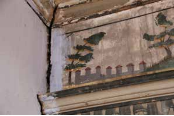
Fig. 16: Duvar ayrılması ve niteliksiz boya tabakası